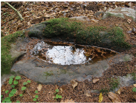
10 pav. Intuponių (Seniavos) akmuo su įduba II.