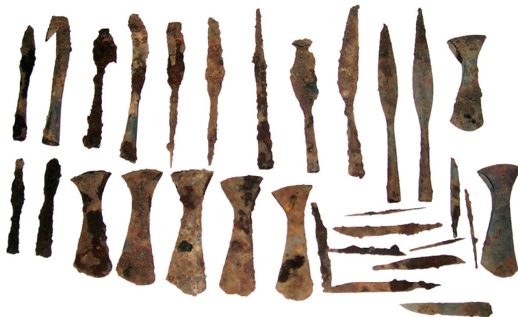
Fig. 4. Some of the finds discovered at the Magūnai barrow site (Švenčionys District).

4 pav. Iš Magūnų pilkapių vietos (Švenčionių r.) kilusių radinių dalis.