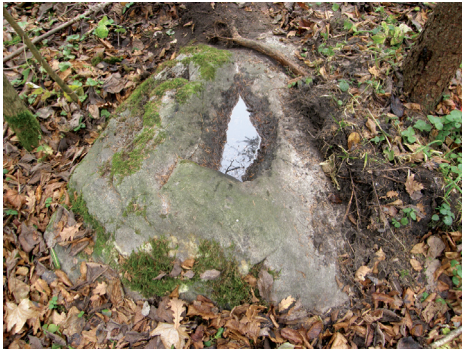
9 pav. Intuponių (Sutruko) akmuo su įduba.