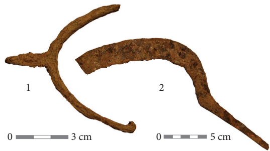
8 pav. Zabarijos (Kryžkelio) pilkapių vietoje (Elektrėnų sav.) rastas pentinas (1) ir pjautuvas (2).

Zavišonių spėjama pilkapių vieta (Šalči- ninkų r.) yra 1,5 km į PV nuo kelio Vilnius– Šalčininkai, laukuose tarp Zavišonių ir Gojas kaimų, 150 m į P nuo aukštos įtampos elektros perdavimo linijos. Žemėlapyje pilkapių žen- klais pažymėto ploto V dalis patenka į dirba- mų laukų plotą, R dalis – į jaunuolyną. Pilka- pių vietoje, priesmėlio lauke pastebimi kiek