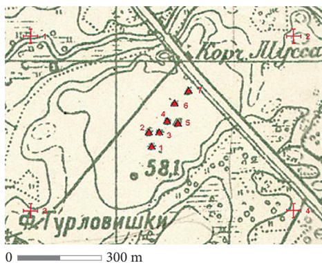
1 pav. Turlojiškių pilkapiai (Širvintų r.) topografiniame žemėlapyje (M 1: 21 000), sudarytame remiantis 1881–1907 m. matavimų duomenimis.