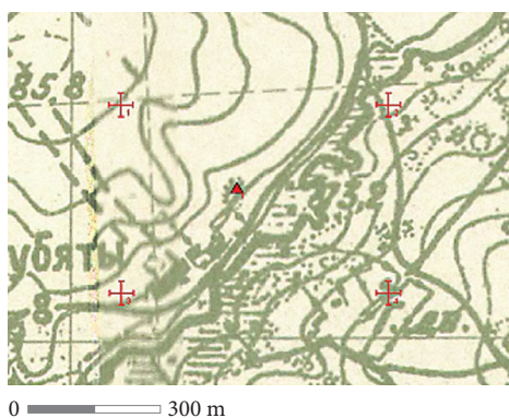
2 pav. Skubėtai (Šalčininkų r.). Ant pilkapio ženklu žemėlapyje pažymėtos kalvos žvalgant lokalizuotas iš akmenų sukrautas pilkapis.