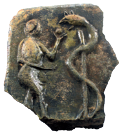
10 pav. Gotikinis koklis su siužetu „Eva, duodanti žalčiui obuolį“.