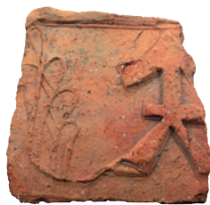
Fig. 9. An earthenware low-relief tile, decorated with the Chodkevičius family coat-of-arms, from pit 3 in trench 31.

9 pav. Molinės reljefinės apdailos plytelės, puoštos Chodkevičių herbu, iš duobės 3 perkasoje 31.