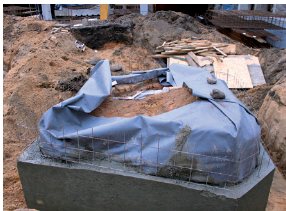
22 pav. Sutvirtinta ir paruošta iškėlimui krosnis 2