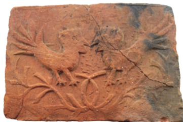
Fig. 8. An earthenware low-relief decorative tile from pit 3 in trench 31.

8 pav. Molinė reljefinė apdailos plytelė iš duobės 3 perkasoje 31.