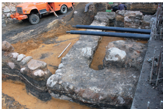
Fig. 14. Fragments of a 16 th –17 th -century foundation recorded in trench 20, as seen from the SE.

1,3 m. Sienos mūrytos iš lauko riedulių ir gotikinių plytų. Rūsio grindys išklotos smulkių akmenų grindiniu bei smulkiomis plytų nuolaužomis. Pamatas datuojamas XVI a. viduriu – pabaiga. Šie pastato pamatai nėra fiksuoti ankstesnėje ikonografinėje medžiagoje, buvusio pastato paskirtis lieka neaiški. Po tyrimų pamatai buvo uždenkti ir išsaugoti in situ po požeminio garažo grindimis.