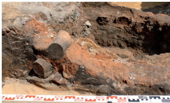
18 pav. Puodyniniai kokliai in situ krosnyje 2 perkasoje 24 iš PV. A. Zalepūgienės nuotr.

Po šia krosnimi, jos PV dalyje atidengtos ir dalinai po ja esančios kitos (puodžiaus) krosnies (K-2) liekanos (18, 19 pav.). Ši krosnis sumontuota iš gamybinių atliekų – puodyninių koklių broko, nuardyta virš jos įrengiant vėlyvesnę krosnį. Krosnis K-2 greičiausiai buvo be kamino, jos viršuje galėjo būti tiesiog susiaurėjusi krosnies kupolo anga. Būtent pro