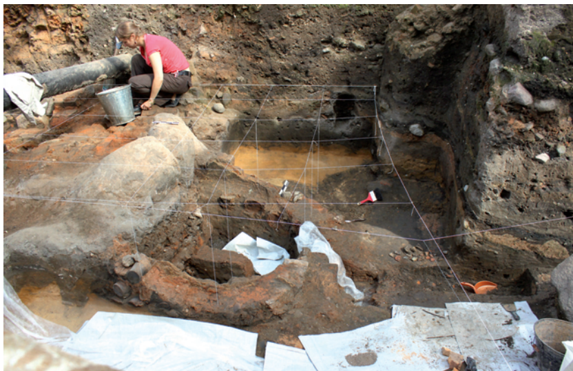
Fig. 19. Furnace 2 during the excavation, as seen from the SW.