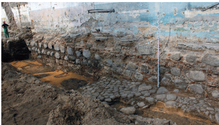
13 pav. Perkasoje 18 atidengta gynybinės sienos atkarpa iš PR.

Fig. 13. A segment of defensive wall unearthed in trench 18 as seen from the SE.