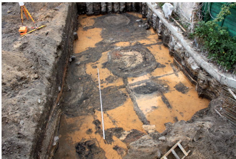
Fig. 12. Trench 26 after reaching sterile soil, as seen from the W.