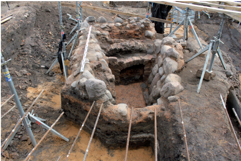
21 pav. Krosnis 3 tyrinimų metu

Fig. 20. Trench 28 after reaching sterile soil, as seen from the SW.