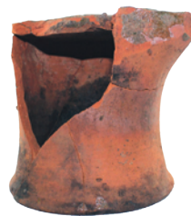
11 pav. Gotikinis koklis su stilizuotu elniu.