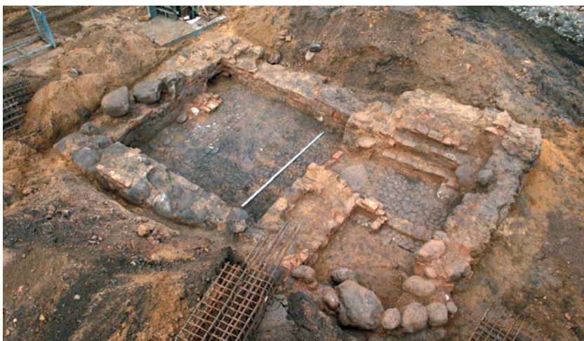
15 pav. XVI a. vidurio pamatai iš viršaus.