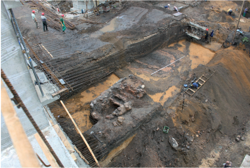
20 pav. Perkasa 28 pasiekus žemę iš PV.

Fig. 20. Trench 28 after reaching sterile soil, as seen from the SW.