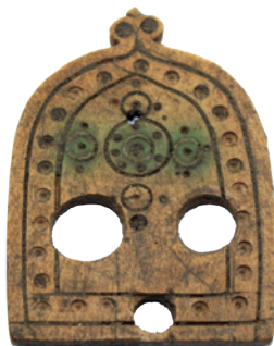
Fig. 3. A bone buzzer from pit 8 in trench 18.