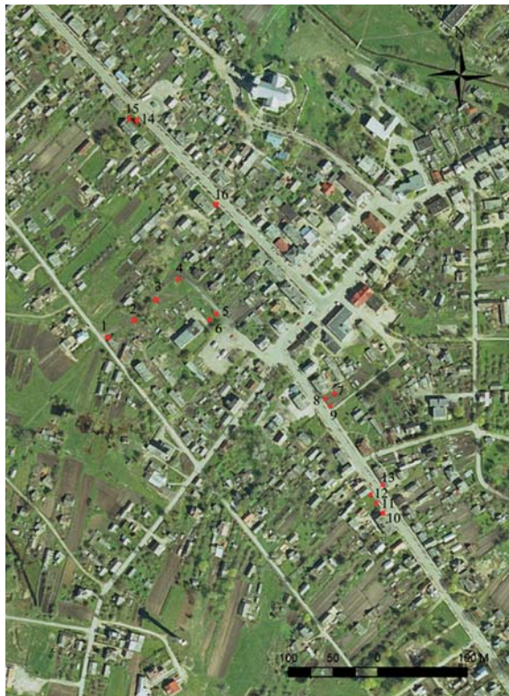
1 pav. Tyrinėtų šurfų vietų 1–16 bendras situacijos planas. A. Žilinskaitės brėž.

Didžiojoje dalyje tirtų šurfų dominuoja perkasti ir ankstesnių žemės judinimo darbų (pastatų statyba, kabelių tiesimas ir kt.) maišyti sluoksniai. Tačiau juose aptiktų radinių chronologija siekia XVI a. ir tęsiasi iki pat naujausių laikų. Viršutiniuose šurfų sluoksniuose dominuoja supiltiniai žvyro, smėlio, statybinių šiukš-